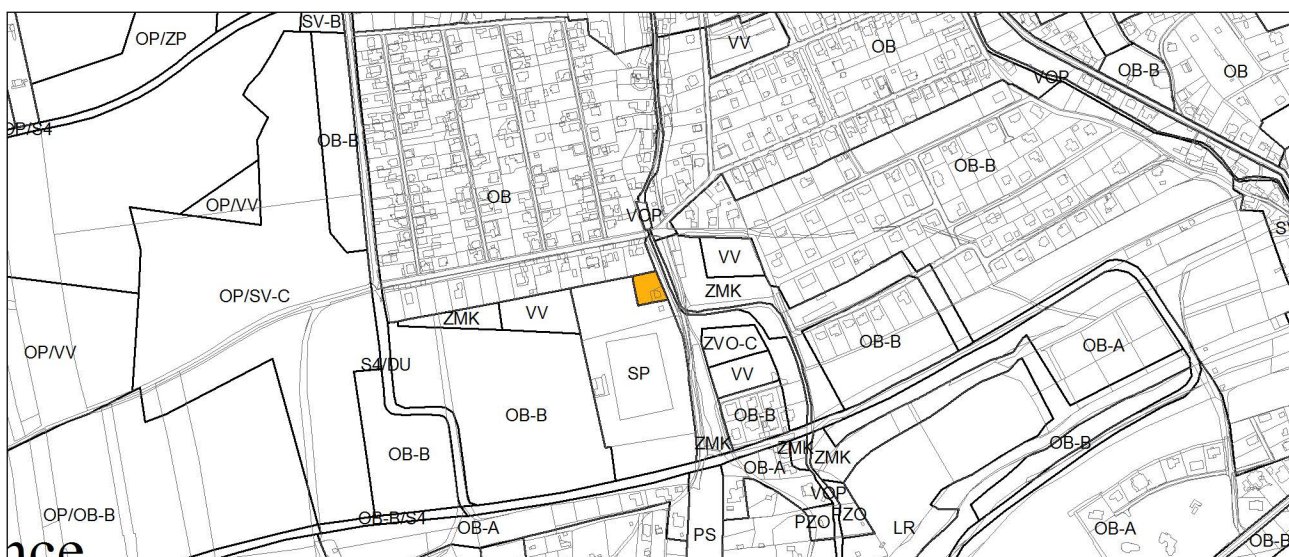
Zákras zadání změny schválený usnesením ZHMP č. 38/74 ze dne 14. 6. 2018